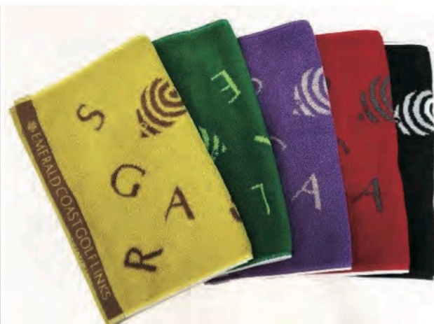
エメラルドコーストゴルフリンクス 様 オリジナルフェイスタオル