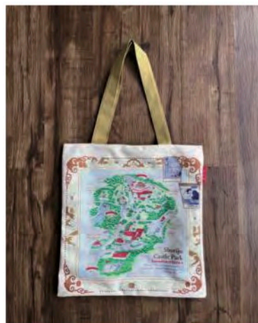
(一財) 沖縄美ら島財団 様 首里城公園トートバッグ