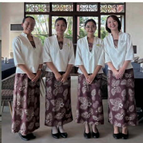
シギラベイクントリークラブ 様 レディーススタッフユニフォーム