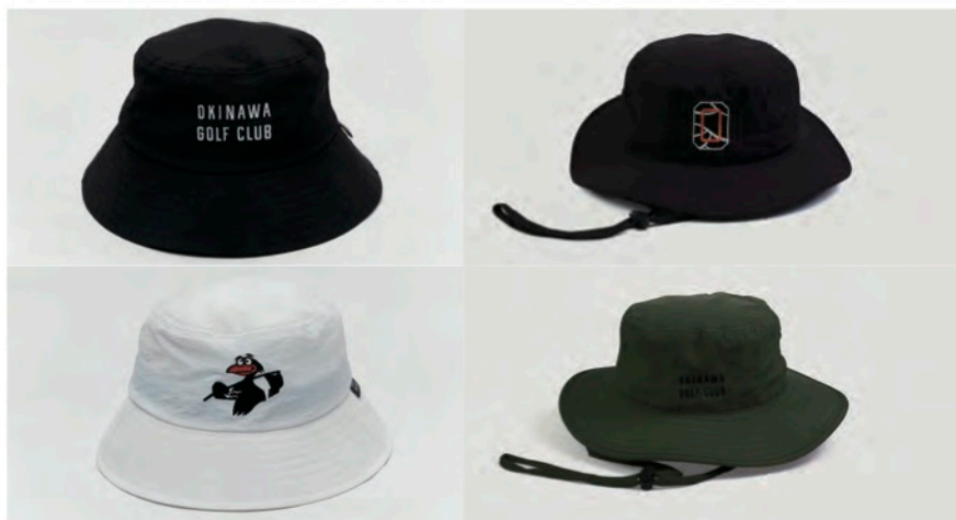
OKINAWA GOLF CLUB バケットハット&サファリハット