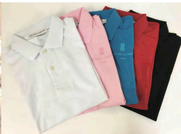
THE RITZ-CARLTON OKINAWA 様 刺繍ポロシャツ