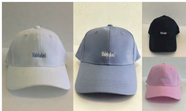
ハレクラニ沖縄 様 オリジナルコットンキャップ (大人用・子供用)