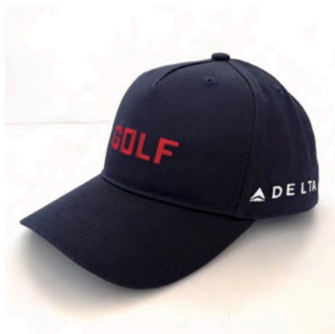
DELTA 航空 様 コットンキャップ