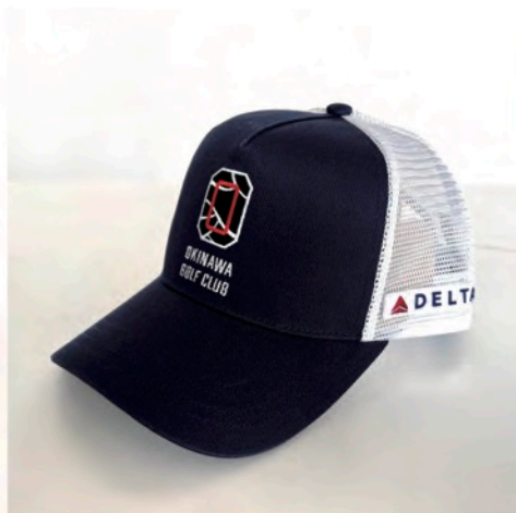
DELTA 航空 様 W ネームメッシュキャップ