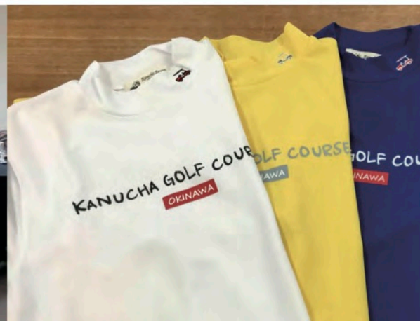
Kanucha Resort Okinawa 様 オリジナルモックネックシャツ