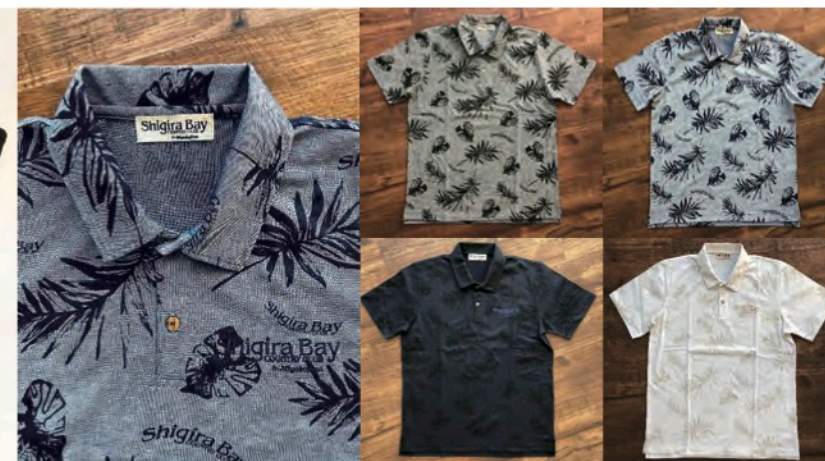
シギラベイクントリークラブ 様 オリジナルテキスタイル総柄プリントポロシャツ