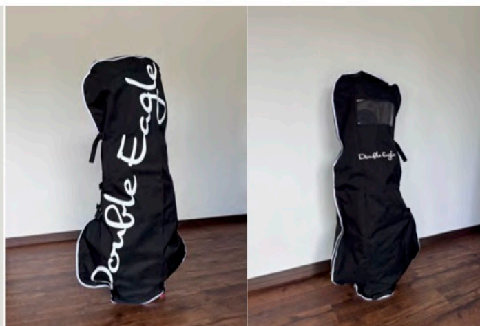
Double Eagle 様 オリジナルポーチ付きトラベルカバー