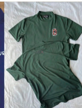
THE OKINAWA OPEN 2024 公式ユニフォーム