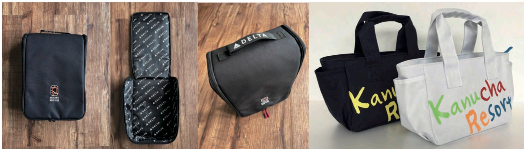
DELTA 航空様 トラベルポーチ