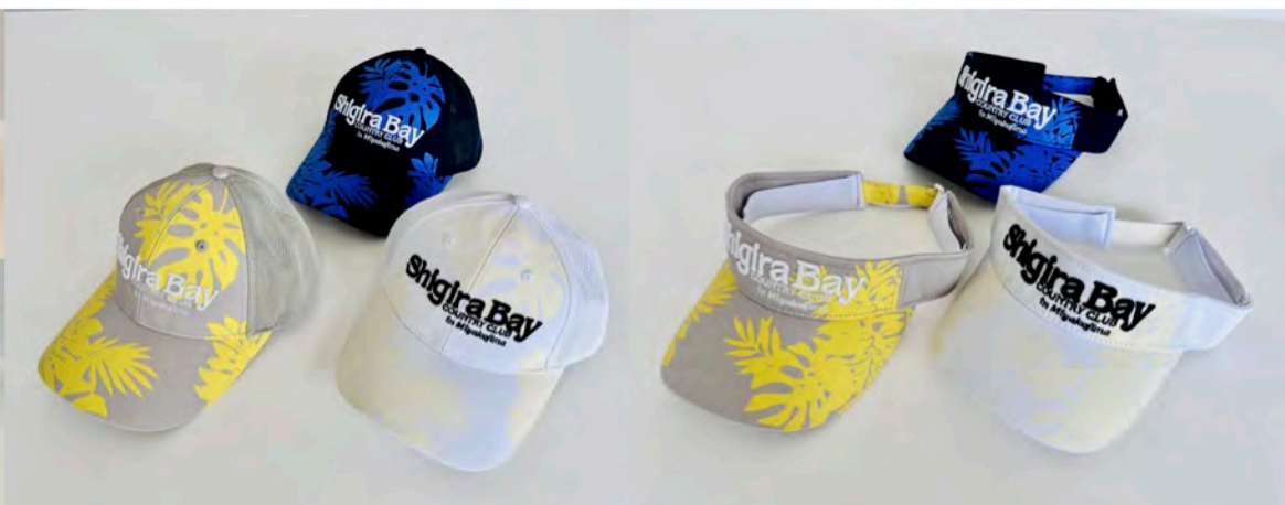
シギリベイカントリークラブ 様 コットンメッシュキャップ・サンバイザー (テキスタイル提案)