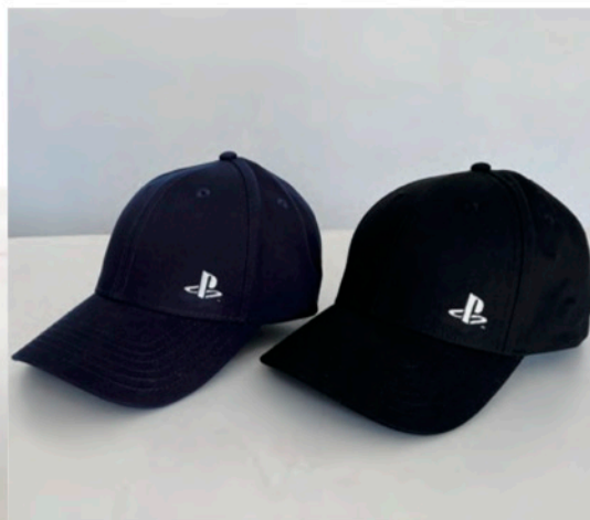
Sony Interactive Entertainment Japan 様 Play Station® オリジナルコットンキャップ・オリジナルトートバッグ