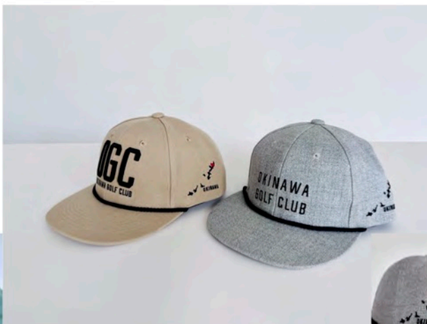
カヌチャゴルフコース様 x OGC W ネームポリエステルロープキャップ