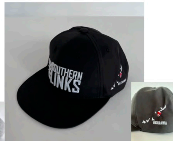
ザ・サザンリンクスゴルフコース様 オリジナルナイロンキャップ