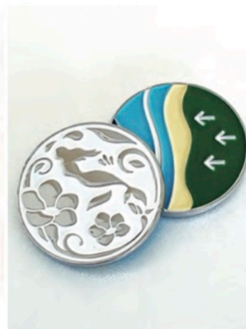
シギラベイカントリークラブ 様 オリジナルスチールマーカー