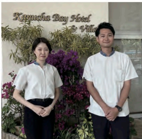
Kanucha Resort Okinawa 様 リゾートスタッフユニフォーム