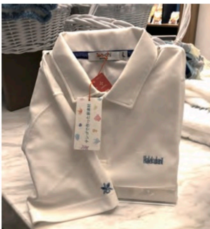
ハレクラニ沖縄 様 サンゴクロス® ポロシャツ