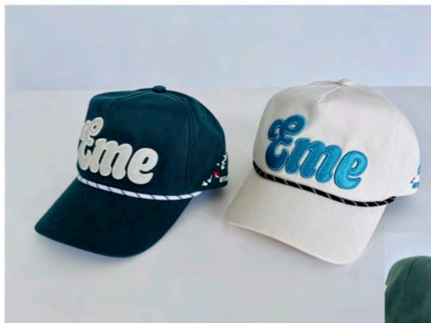
エメラルドコーストゴルフリンクス様 オリジナルコットンロープキャップ

ROPE CAP ・ BUCKET HAT ・ SAFARI HAT ・ TRAVEL COVER